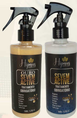
SEVEM ACTIVE + SEVEM OURO R$ 159,00