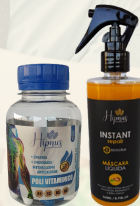
POLIVITAMÍNICO + MÁSCARA LÍQUIDA R$ 159,00