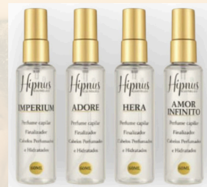
KIT PERFUME CAPILAR R$ 159,00