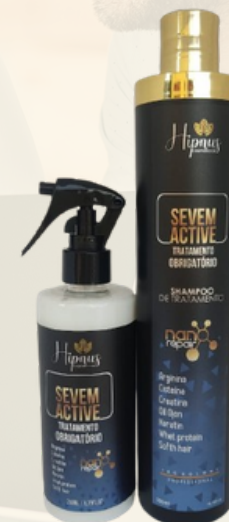
SHAMPOO + SEVEM ACTIVE R$ 159,00