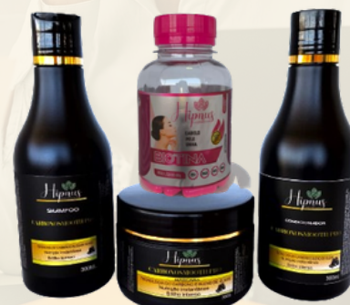
BIOTINA + KIT CARVÃO ATIVADO R$ 159,00