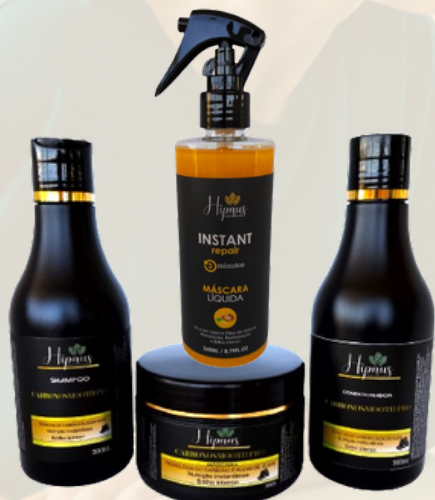
KIT CARVÃO ATIVADO + MÁSCARA LÍQUIDA R$ 159,00